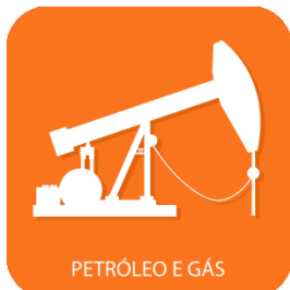
PETRÓLEO E GÁS