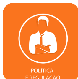
POLÍTICA E REGULAÇÃO

A empresa russa Gazprom confirmou a interrupção do fornecimento de gás à Ucrânia, depois do anúncio da véspera de Kiev sobre a suspensão da compra de gás da Rússia após o fracasso das negociações sobre os preços. O corte do fornecimento não deve ameaçar a entrega de gás russo à União Europeia - metade do gás para o bloco passa pelo território ucraniano. A empresa pública ucraniana Naftogaz prometeu que garantiria o trânsito do gás russo para os demais clientes europeus. A Comissão Europeia também garantiu que o