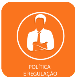
POLÍTICA E REGULAÇÃO

As distribuidoras de energia que passarem por intervenção administrativa da Aneel terão de aplicar os valores da compensação financeira ao consumidor que tiveram o pagamento suspenso durante o processo em investimentos na área de concessão. Esses recursos deverão ser contabilizados como investimentos vinculados à prestação do serviço público de energia e não serão reconhecidos para efeito de repasse às tarifas. A determinação aprovada pela agência reguladora, altera a Resolução Normativa nº 524, que estabelece o regime excepcional de sanções regulatórias na hipótese de intervenção administrativa nas concessionárias da distribuição. Ela melhora o entendimento sobre a aplicação dos recursos, que normalmente seriam pagos aos consumidores por causa do descumprimento pelas empresas dos indicadores de qualidade individuais, mas foram suspensos em razão do tratamento diferenciado previsto para essas empresas. A norma será aplicada a Celtins (TO) e Cemat (TO), distribuidoras do antigo grupo Rede adquiridas no ano passado pelo grupo Energisa, após passarem por intervenção entre 31 de agosto de 2012 e 14 de abril de 2014. Os valores devidos e não pagos pelas duas empresas serão atualizados pelo IGP-M e aplicados na melhoria da qualidade do serviço prestado.